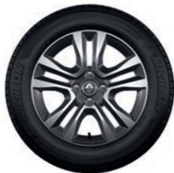
Rines de aluminio bitono diamantado de 16"