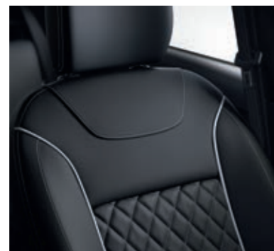
vestiduras de asiento de piel sintética